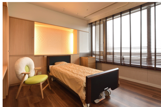
南4階特別室（女性専用）1泊2日 36,300円