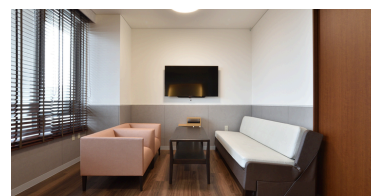
大型モニターを使用した結果説明

※タオル、バスタオル、スリッパ、歯ブラシセット、シャンプー・リンス ボディソープ、ボディタオル、ヘアブラシ、髭剃り、ティッシュ