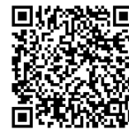
ホームページQRコード

随時実施しています（平日のみ）。 病院ホームページよりお気軽にお申し込みください。